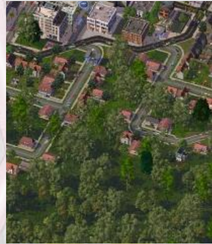
Gelungener Übergang zwischen Stadt und Landschaftsschutzgebiet in Knotenburg, Region Salst.

5.10 In Unterezentren sind kleine Landebahnen in der Regel zulässig. In Mittelzentren sind kleine Landebahnen zulässig.