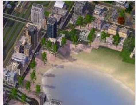
Gelungener Ort für Kommunikation – Die Seepiazza im Zentrum von Salst

7.7 Einrichtungen der Erholung (bspw. Stadion) bedürfen der Zustimmung des Amtes für regionale Raumordnung der Region Salst.