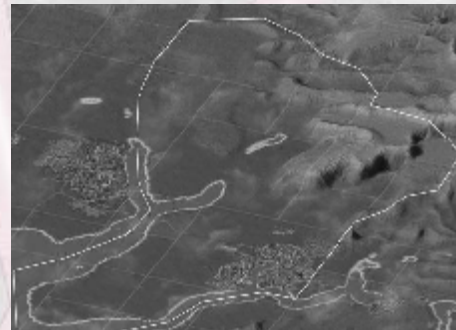
Abgrenzung der Region Salst

3.5 Im Unterzentrum ist ein Kern (max. 30% der Siedlungsfläche) mit dichter Bebauung zulässig. Die sonstige Bebauung liegt im Ermessen der Gemeinde.