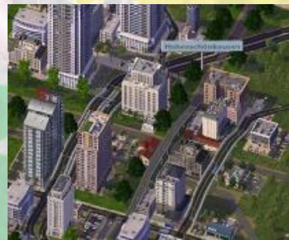
Integrierte Lage des Bahnhofes in Salst-Hohenschönhausen