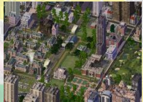
Bildungszentrum Salst – Die Universität der Stadt sowie verschiedene Institute in der Umgebung