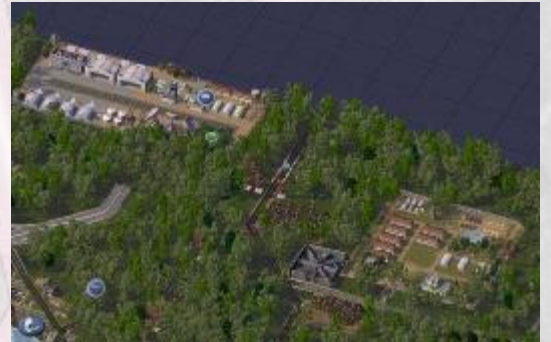
Maximale Ausnutzung der Sonderbauflächen im Mittelzentrum Knotenburg – Ein Beispiel der sinnvollen Einbettung dieser Nutzung in das Landschaftsbild.

10.2 Die Genehmigung des Abweichens von einem Ziel der Raumordnung erteilt das Amt für regionale Raumordnung der Region Salzt.